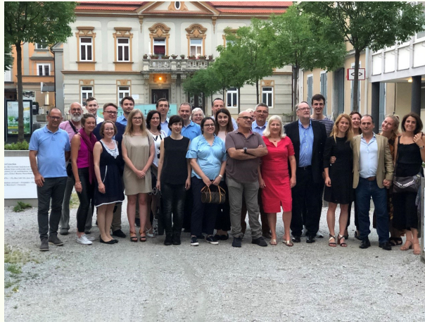
Spotkanie inauguracyjne projektu EU-En4s, Maribor (Słowenia), 26–29 czerwca 2019 r.

Udział w projekcie EU-En4s rodzi nadzieję na pogłębienie dotychczasowego zaangażowania CBKE w budowanie i umacnianie unijnych działań na rzecz rozwoju przestrzeni wolności, bezpieczeństwa i sprawiedliwości w Unii Europejskiej. W jego ramach prowadzone są prace przyczyniające się zarówno do zwiększenia rozpoznawalności Uniwersytetu Wrocławskiego na arenie europejskiej, jak i do rozwoju badań istotnych z punktu widzenia harmonijnego funkcjonowania rynku jednolitego UE, warunkującego stały rozwój gospodarczy Europy. Projekt EU-En4s ma charakter nowatorski, stanowiąc z jednej strony projekt, którego efektem ma być poszerzenie wiedzy teoretycznej na temat międzynarodowego postępowania cywilnego w Unii Europejskiej, z drugiej strony zakładając stworzenie i testowanie zaawansowanych narzędzi technologicznych służących usprawnianiu transgranicznego postępowania egzekucyjnego, a tym samym zwiększających ochronę interesów prawnych obywateli Unii Europejskiej.