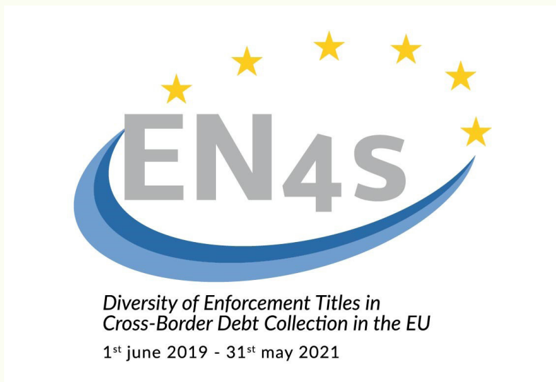
Logo projektu EU-En4s