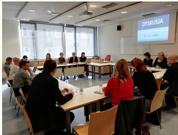
Krajowe warsztaty z ekspertami z zakresu transgranicznego dochodzenia wierzytelności, Wrocław, 13 września 2019 r.