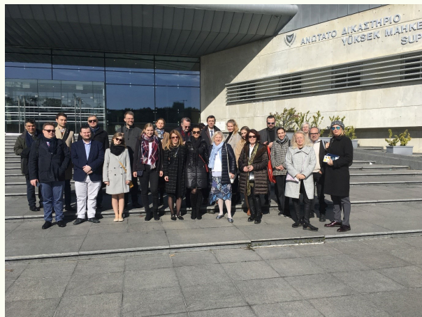
Drugie spotkanie eksperckie w projekcie EU-En4s, Sąd Najwyższy w Nikozji (Cypr), 22–25 stycznia 2020 r.